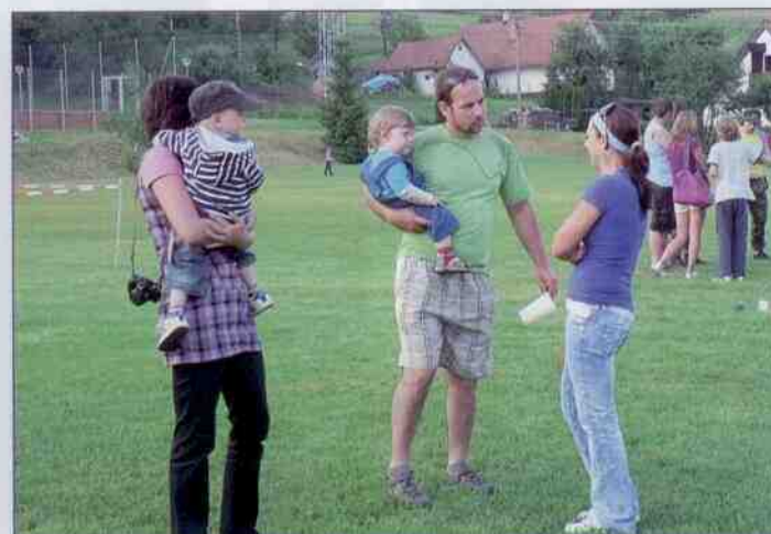
Dětský den 2011