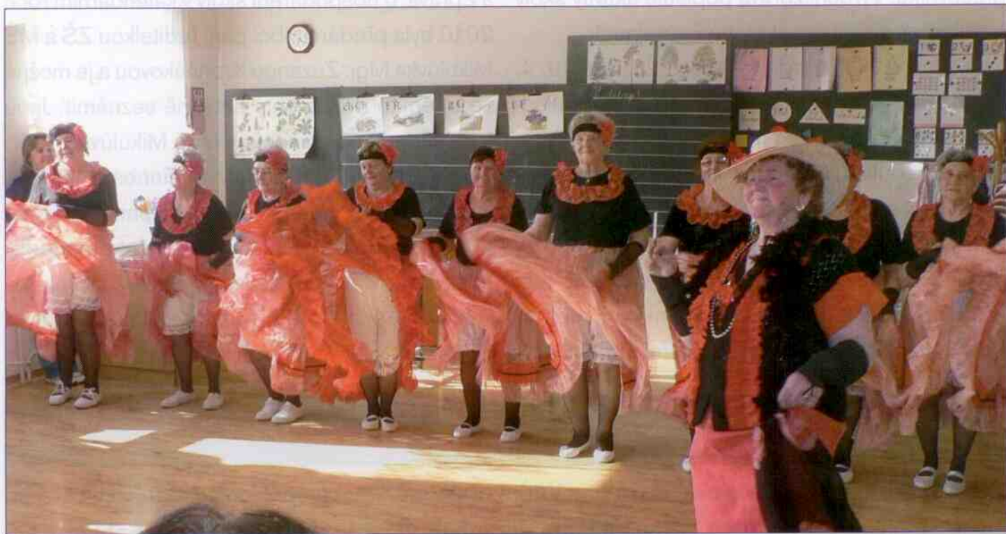
Posezení se seniory duben 2011