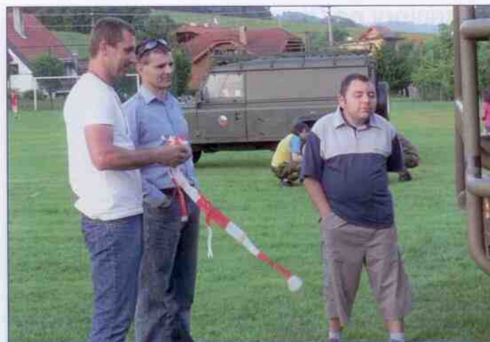
Dětský den 2011