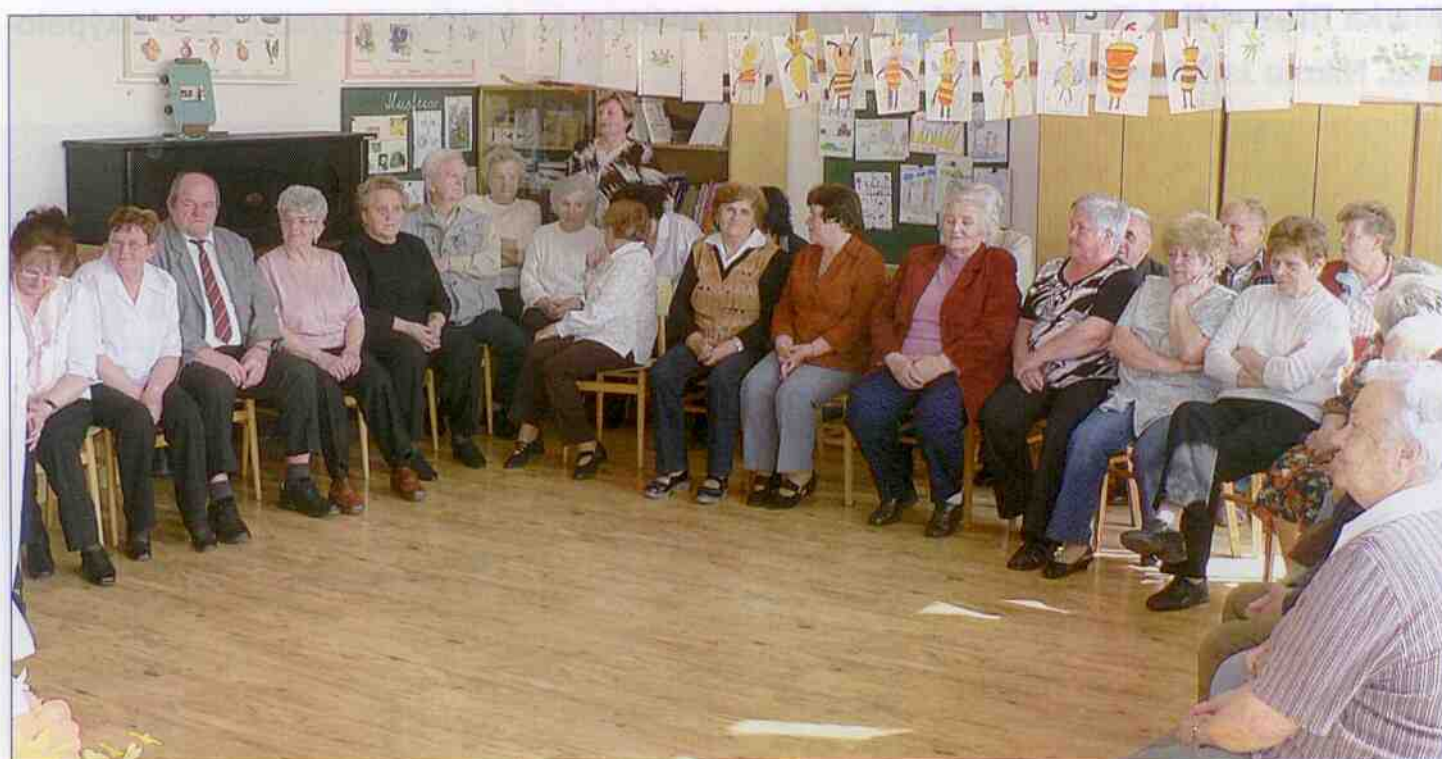
Posezení se seniory duben 2011