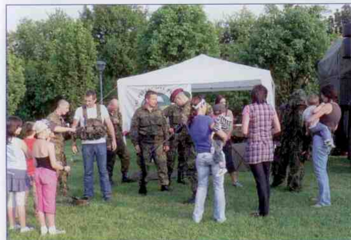
Dětský den 2011