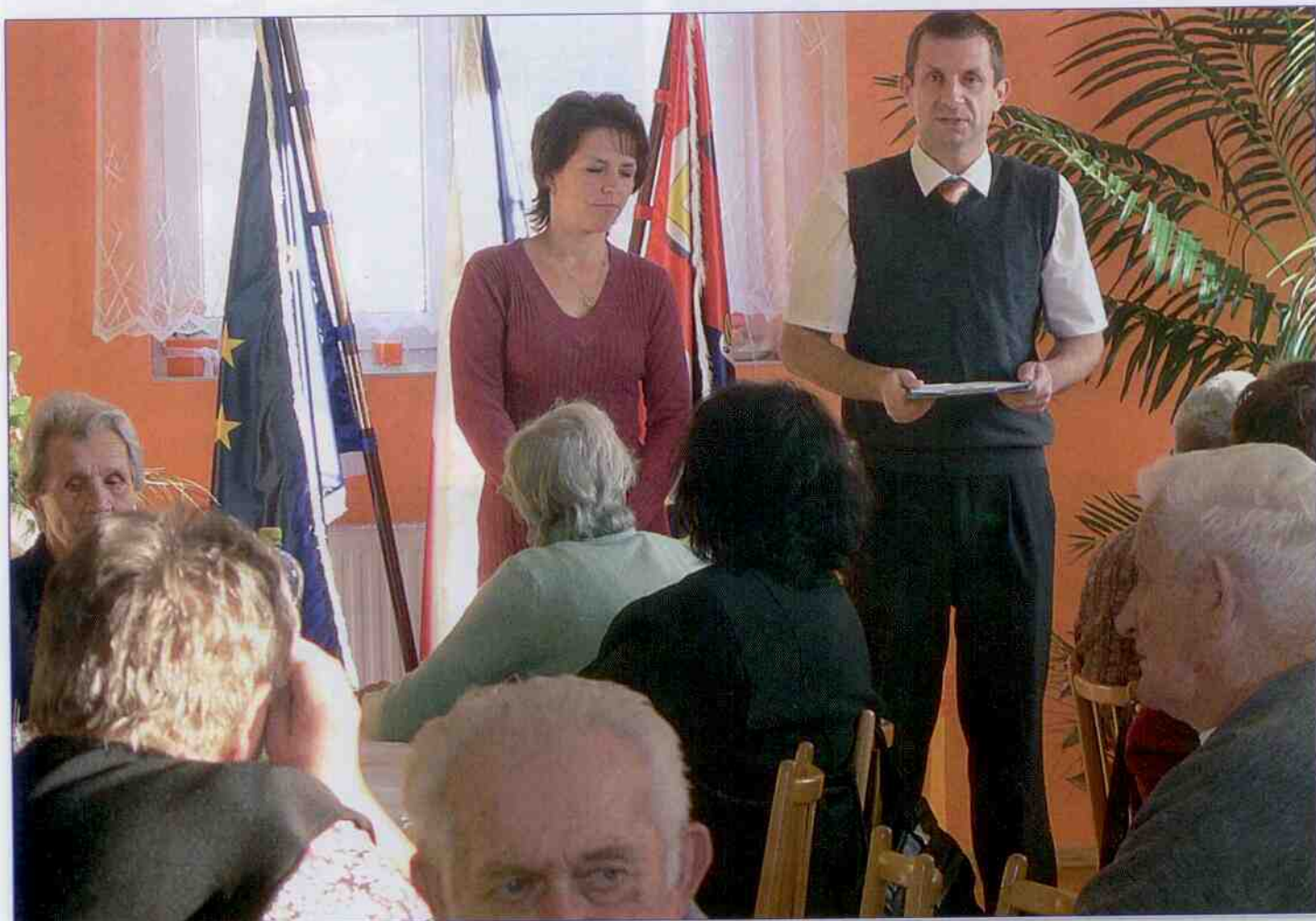
Posezení se seniory listopad 2011