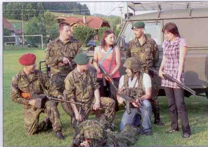
Dětský den 2011