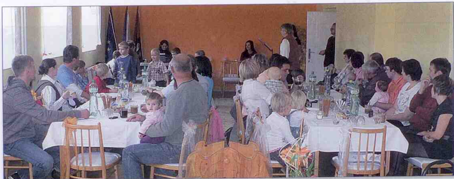
Vítání občánků 2011