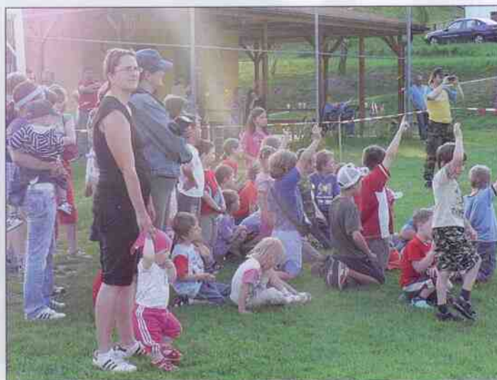
Dětský den 2011