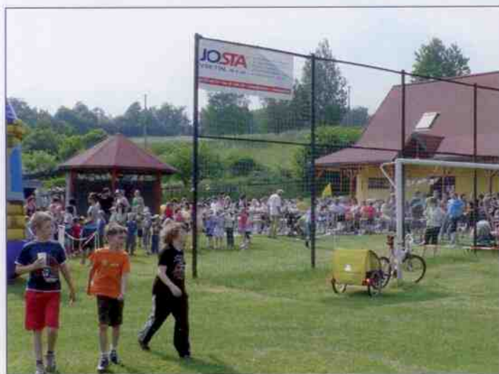
Dětský den 2011